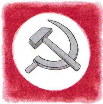
Secera și ciocanul, simbolul internaționalismului comunist

De ce? Pentru că unele dintre țările astfel comunizate, precum Ungaria și România, fuseseră aliate ale Germaniei naziste și participaseră la invadarea URSS-ului alături de armata hitleristă. Ele aveau de plătit despăgubiri de război uriașe pentru jafurile, distrugerile și victimele omenesti făcute pe teritoriul sovietic în timpul războiului. Altele, așa cum erau Polonia și Cehoslovacia, fuseseră victime ale nazismului, iar acum deveneau, în plus, și victime ale Armatei Roșii. Nici ele nu s-au putut împotrivi, așadar, prea mult, deoarece erau vlăguite de război și lipsite de o susținere internațională reală. Țările care le-ar fi putut ajuta, Marea Britanie și Franța, se aflau ele însele într-o situație economică dificilă, care, pe de-o parte, nu le permitea să se opună prea tare ocupației sovietice a Europei de Est și, pe de altă parte, le făcea dependente de ajutorul economic al SUA. Sub conducerea unui nou președinte, Harry S. Truman, Statele Unite ale Americii au înțeles însă repede pericolul